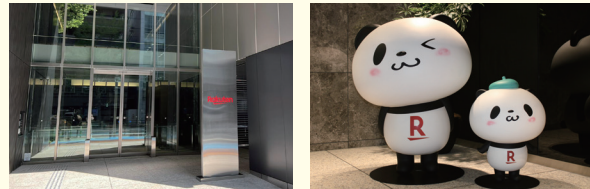
■楽天カード福岡オフィス

私たちは「クレジットカード」を通して、お客様に安心・安全・便利な生活を送ってもらえるサービスを提供しています。インターネットサービスでおなじみの「楽天」のグループ会社として、クレジットカードを発行。現金を使わずに支払えることはもちろん、貯めたポイントや電子マネーをはじめ、最近ではスマートフォンからも支払えるしくみを作るなど、お客様が快適な生活を送るためのお手伝いをしています。